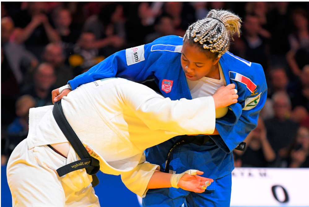
La championne de judo Romane Dicko (en kimono bleu) a remporté un grand tournoi à Paris, le 9 février 2020... juste avant que l'épidémie de Covid-19 n'arrive en France.

Reprendre ensemble le chemin du stade, replonger dans une piscine, suer dans une salle de musculation... Les sportifs de haut niveau en rêvaient, après ces longs mois de confinement. Ils ont confié à 1jour1actu leur bonheur de reprendre l'entraînement... et leur envie de retrouver un jour la compétition !