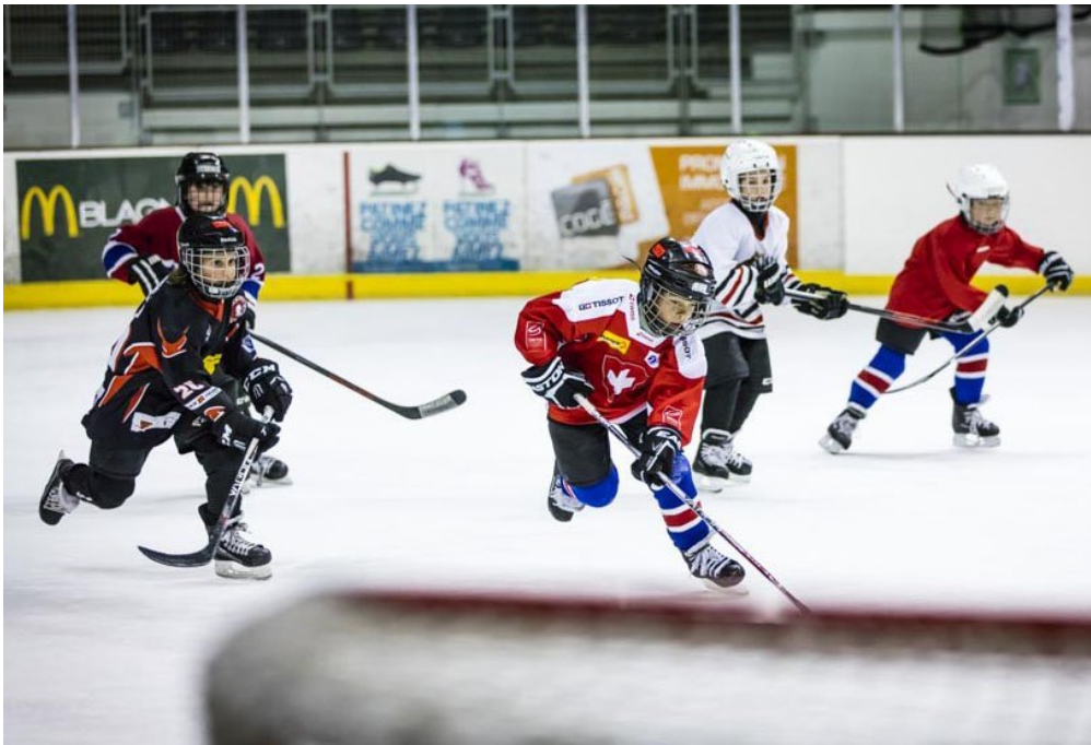
Glisse, vitesse, engagement : le hockey est un sport fun !