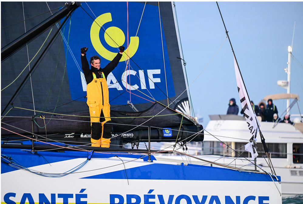
Charlie Dalin sur son bateau à l'arrivée du Vendée Globe