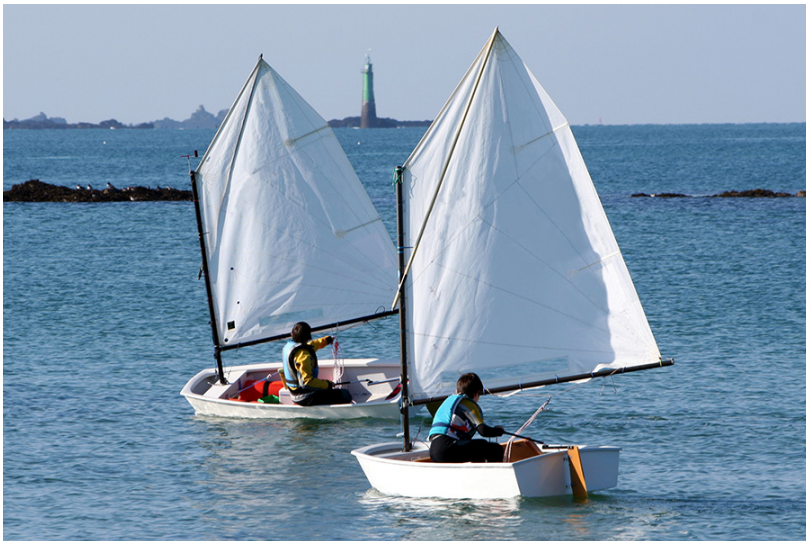
Voici à quoi ressemble un Optimist !