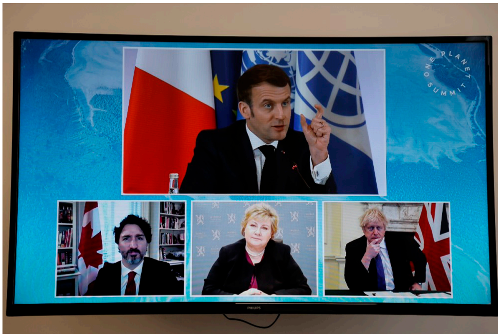
Lors du One Planet Summit, Emmanuel Macron discute avec les premiers ministres canadien, norvégien et anglais.

« Agir pour la biodiversité », c'est le thème principal de cette 4 e édition du One Planet Summit. Dirigeants de pays, grandes associations de protection de la nature et organisations internationales se sont réunis (sur Internet) dans le but de trouver des solutions pour préserver la vie animale et végétale sur terre.