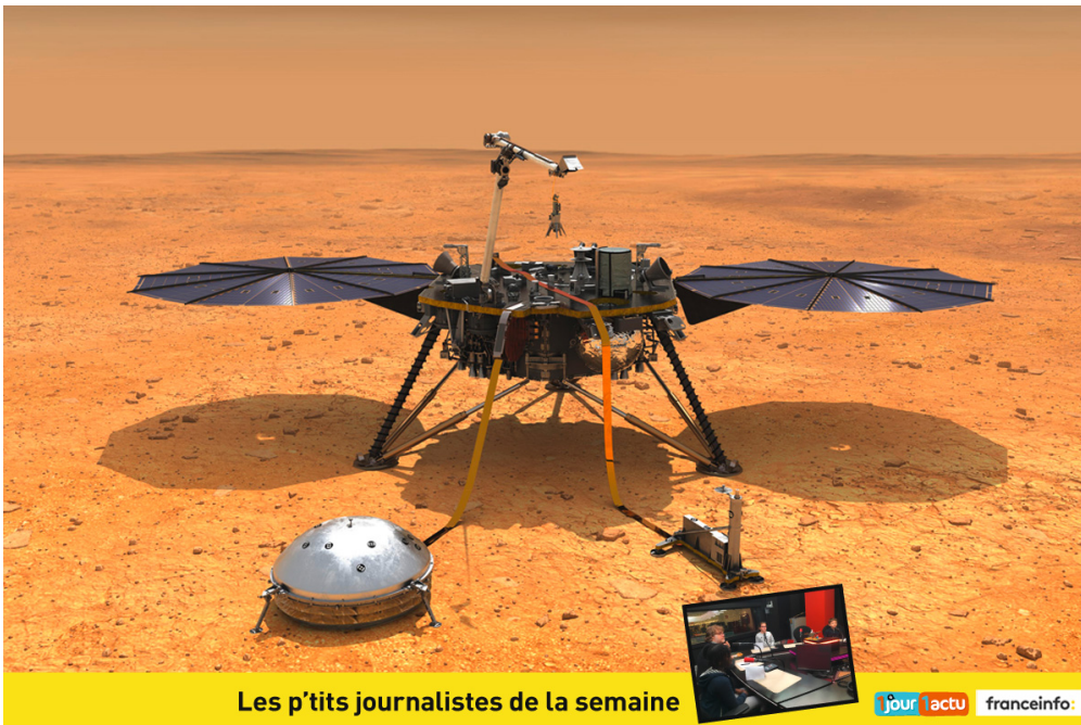
Les p'tits journalistes de la semaine

Ça y est ! Après un long voyage dans l'espace, la sonde InSight s'est posée sur Mars, le 26 novembre 2018. Elle va pouvoir commencer son travail d'analyse de la Planète rouge. Pour en savoir plus, les p'tits journalistes de franceinfo junior, partenaire d'1jour1actu, ont interviewé un chercheur français qui participe à la mission InSight.