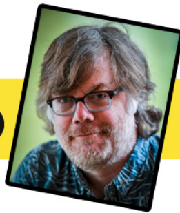
(© Estelle Faure / franceinfo junior – © Stéphane de Sakutin / AFP)