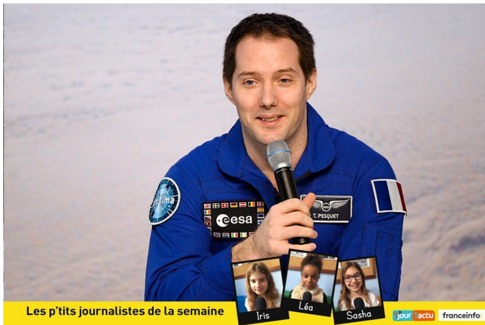
Thomas Pesquet enchaîne les interviews depuis son retour sur terre.

Jour après jour, depuis son décollage, en novembre dernier, jusqu'à son atterrissage, début juin, nombreux sont ceux qui ont suivi Thomas Pesquet lors de son premier voyage dans l'espace. Et toi, t'a-t-il fait rêver ? Écoute les p'tits journalistes de franceinfo junior qui ont pu lui poser leurs questions.