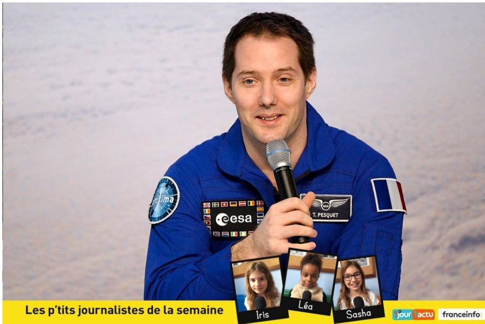
Les p'tits journalistes de la semaine

Jour après jour, depuis son décollage, en novembre dernier, jusqu'à son atterrissage, début juin, nombreux sont ceux qui ont suivi Thomas Pesquet lors de son premier voyage dans l'espace. Et toi, t'a-t-il fait rêver ? Écoute les p'tits journalistes de franceinfo junior qui ont pu lui poser leurs questions.