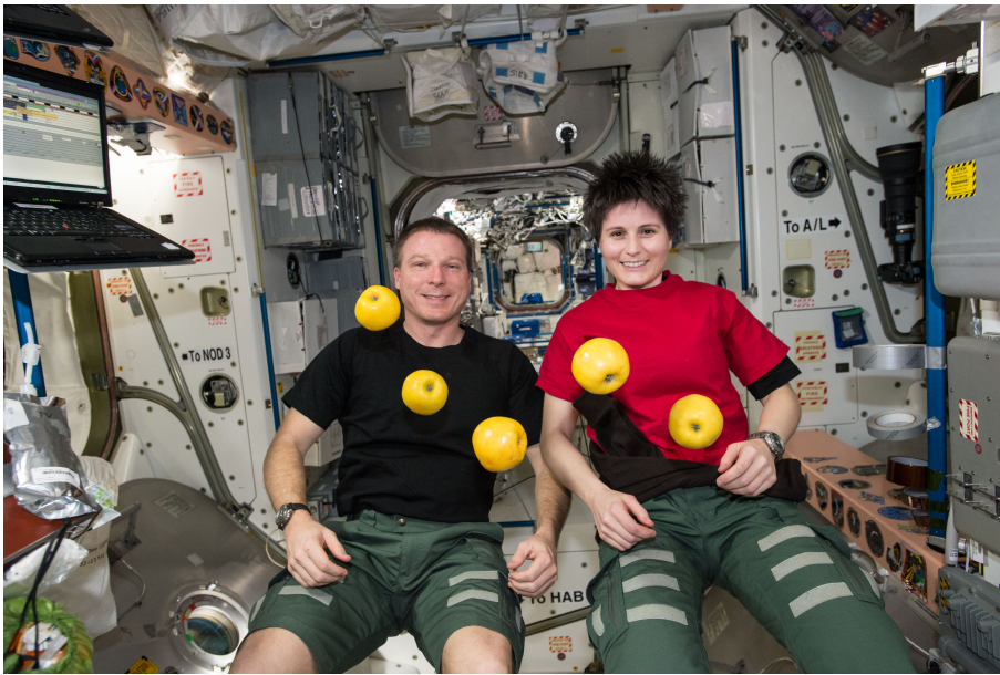
À bord de l'ISS, tout vole et flotte, même les astronautes. C'est en raison de l'apesanteur. Pas facile de se déplacer !