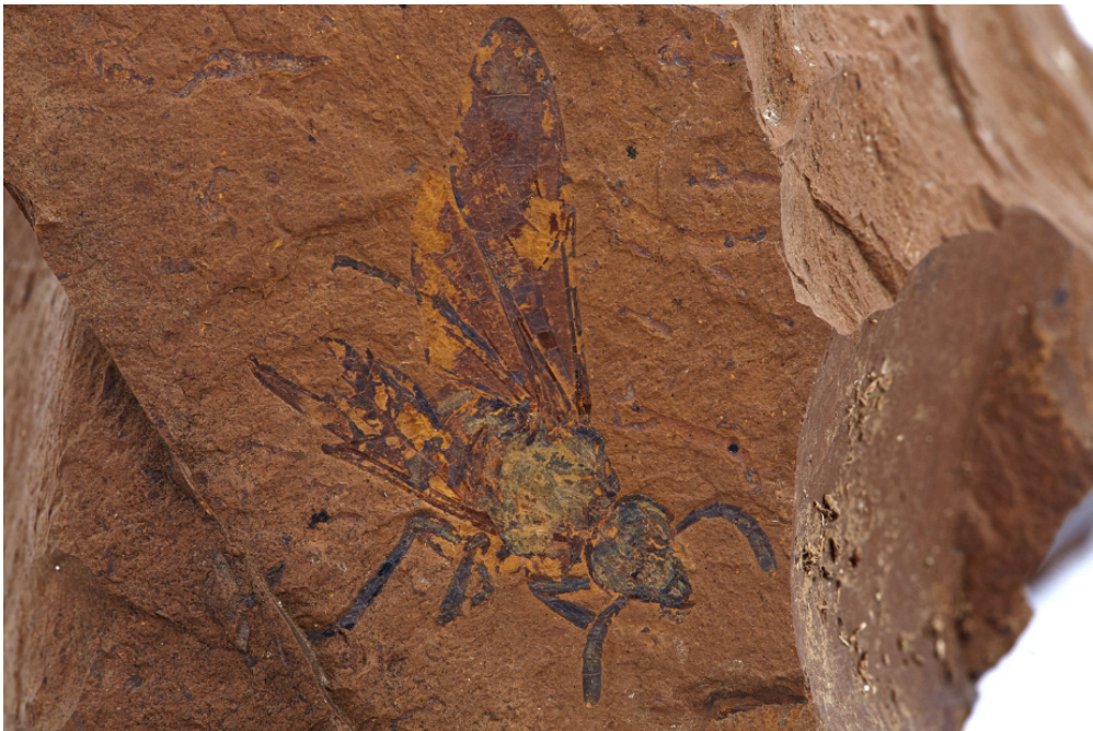
Cette sorte de mouche vivait en Australie il y a plus de 11 millions d'années.

Des milliers de fossiles d'insectes, de plantes et d'animaux qui vivaient en Australie il y a plus de 11 millions d'années... voilà ce qu'ont révélé des scientifiques, le 7 janvier. 1jour1actu t'explique pourquoi cette découverte est exceptionnelle.