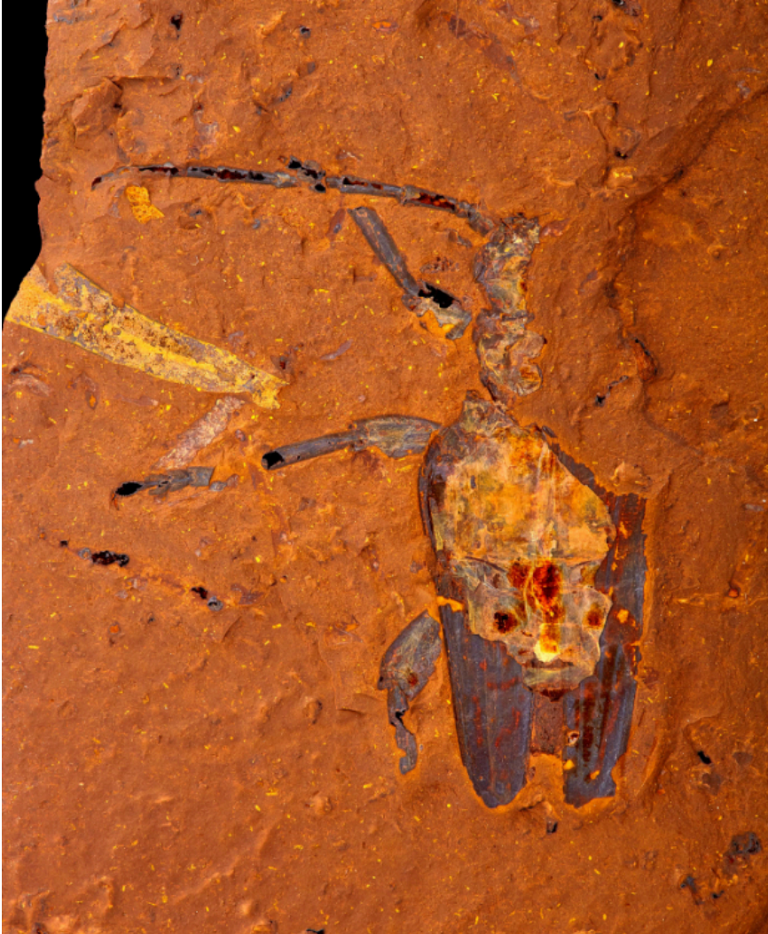
Cet insecte aux longues antennes appartient à la famille des capricornes.