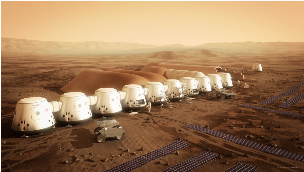
Ces capsules ont été imaginées pour accueillir les premiers humains vivant sur Mars ©Bryann Versteeg / Mars One.

Lors de la Semaine de la presse dans l'école, la classe de CM1-CM2 de l'école des Oustaloux, à Toulouse, a visité la rédaction d'1jour1actu. Les élèves ont assisté à la conférence de rédaction au cours de laquelle les journalistes décident des sujets de la semaine. Un groupe d'enfants a choisi d'écrire un article sur le projet Mars One et de l'illustrer. C'est l'article que nous te proposons aujourd'hui sur le site d'1jour1actu.com