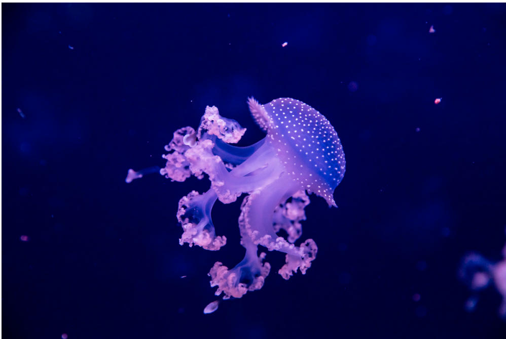
La méduse constellée est l'une des espèces présentées à l'Aquarium de Paris. On la reconnaît grâce aux petits points blancs sur son ombrelle.

On trouve les méduses en grand nombre dans les océans, mais il est beaucoup plus rare de les observer en captivité, car leur élevage est très difficile. Pour en savoir plus, 1jour1actu a visité les coulisses de l'Aquarium de Paris, l'un des seuls endroits en Europe où le public peut contempler ces animaux étranges et fascinants... sans risquer de se faire piquer !