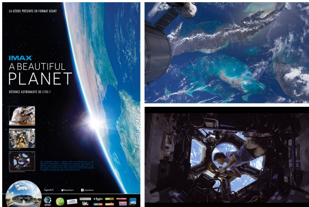
Le nouveau film projeté à la Géode montre de splendides images de l'espace.

Imagine-toi à la place de l'astronaute Thomas Pesquet, à 400 km de la Terre, dans la Station spatiale internationale... C'est l'expérience ébouriffante que te propose de vivre la Géode, à Paris, avec ce documentaire filmé dans l'espace. Participe vite à notre jeu-concours pour gagner ton entrée à la Géode avec 1jour1actu !