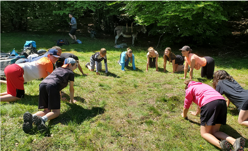
C'est l'heure de la séance de yoga

Lola : On a beaucoup marché. Il y avait trois ânes qui nous accompagnaient : Pacotille, Maestro et Aïssou. On a bien parlé avec les copains. Puis, le soir, on devait installer les tentes, préparer à manger... On a aussi fait du yoga.