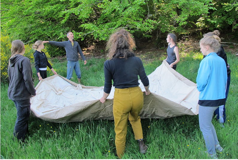
Ensemble, les élèves montent les tentes (© D.R.)