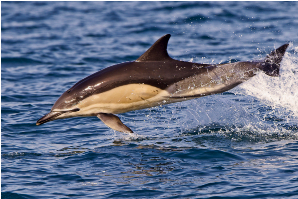
Voici un dauphin commun. C'est l'espèce de dauphin que l'on trouve le plus dans le golfe de Gascogne.

Du 22 janvier au 20 février, les bateaux de pêche de plus de huit mètres n'ont pas le droit de travailler dans le golfe de Gascogne. C'est la deuxième année que cette interdiction est mise en place. Le but : protéger les dauphins.