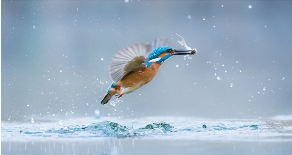
Martin-pêcheur, par Gàbor Li (17 ans, Hongrie). ©World Wildlife Day

Voilà la photo gagnante, révélée aujourd'hui à New York : un martin-pêcheur photographié en plein vol par Gàbor Li, un jeune Hongrois de 17 ans !