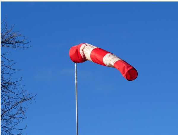
La manche à air est aussi