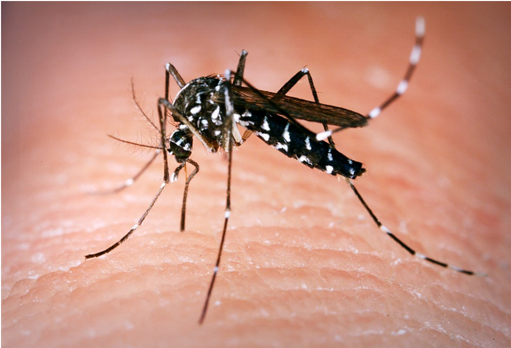
Ce moustique-tigre est en train de piquer la peau de quelqu'un.

Chaque année, c'est la même chose : les moustiques débarquent en mai et te piquent pendant tout l'été. Ils t'attaquent dans le jardin, sur la terrasse, dans les parcs... et même, quelquefois, dans ta chambre ! 1jour1actu t'en dit plus sur ces piqûres qui démangent tant.