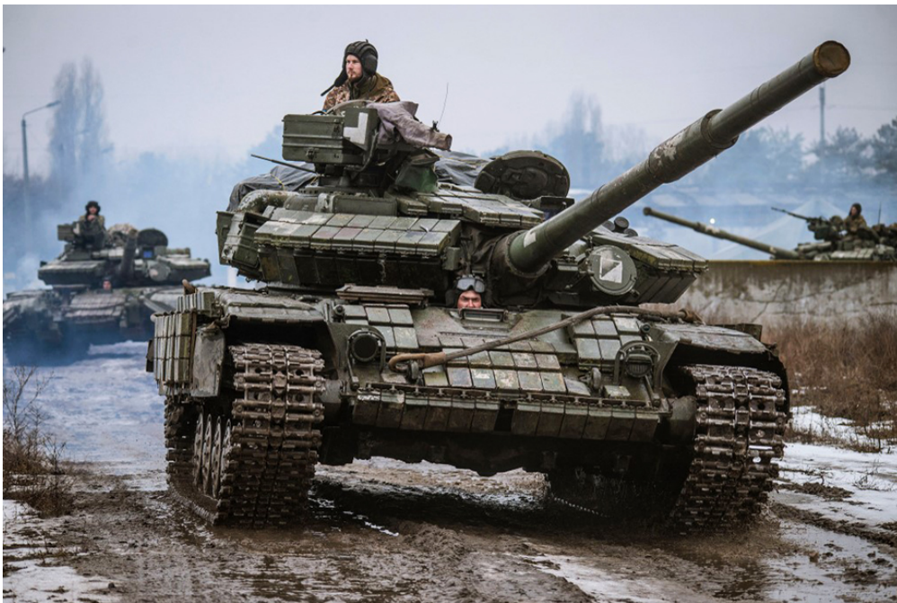
Ces militaires ukrainiens se trouvent dans la région du Donbass, en Ukraine. La photo a été prise le 24 février 2022.

On en parle partout à la radio, à la télé et dans les conversations des adultes autour de toi : après plusieurs semaines de menaces, la Russie vient d'attaquer l'Ukraine. Ces deux pays sont en conflit depuis de nombreuses années, mais les choses se sont accélérées hier. 1jour1actu te raconte ce qui s'est passé.