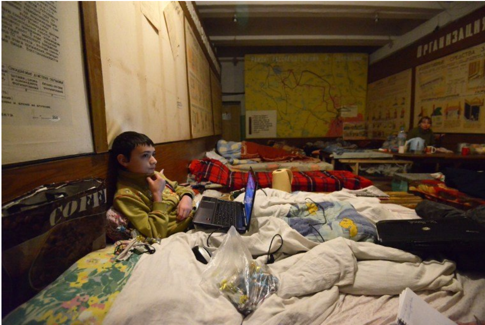
Ce garçon de 10 ans attend la fin des tirs d'artillerie, dans une cave du quartier de Petrovski, à Donetsk.

Paul est un journaliste qui travaille en Ukraine depuis quelques mois. Il a passé du temps à Donetsk, l'une des villes prises par les séparatistes. Il a raconté à 1jour1actu comment les habitants continuent à vivre.