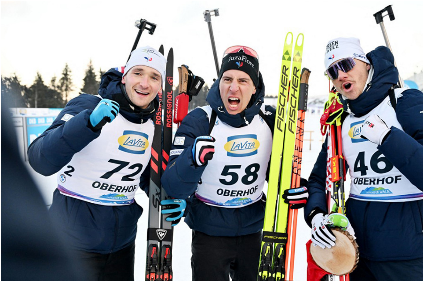
Voici, de gauche à droite, Fabien Claude, Quentin Fillon Maillet et Émilien Jacquelin. Bravo, les champions !