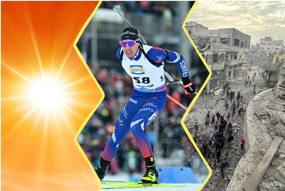
(Soleil : © Günter Albers / Adobe Stock. Le biathlète Quentin Fillon Maillet en plein effort : © M. Schutt / Picture Alliance / DPPI / AFP. Vue de Gaza le 16 janvier 2025 : © Hasan N. H. Alzaanin / Anadolu / AFP.)

Ça s'est passé entre le 10 et le 17 janvier. L'année 2024 a battu des records de chaleur, les Français ont brillé en biathlon, et un accord a été trouvé pour essayer de mettre fin à la guerre à Gaza. 1jour1actu te raconte.