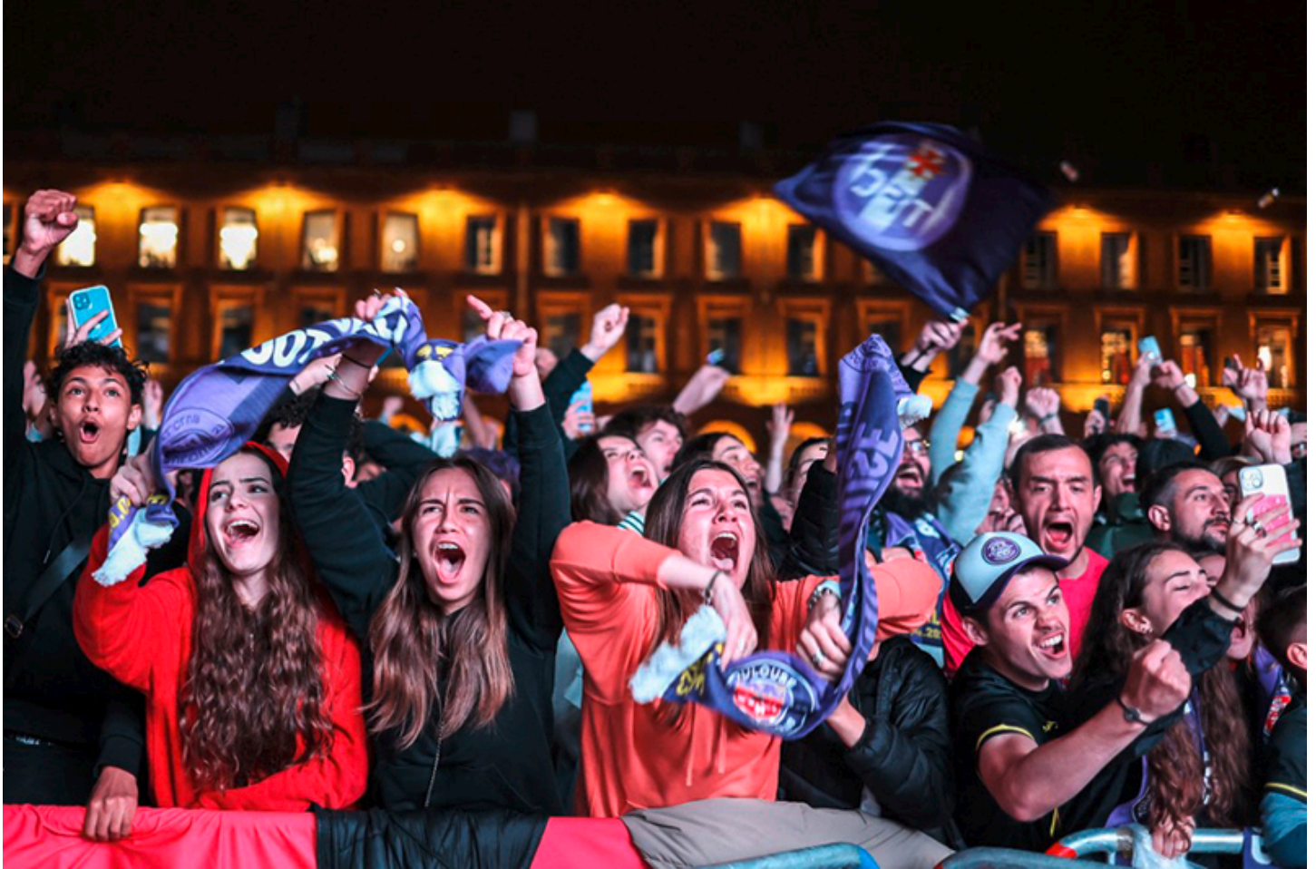
Pour suivre le match, un grand écran était installé sur la place du Capitole à Toulouse. Le public venu nombreux a pu crier sa joie de voir gagner le TFC.