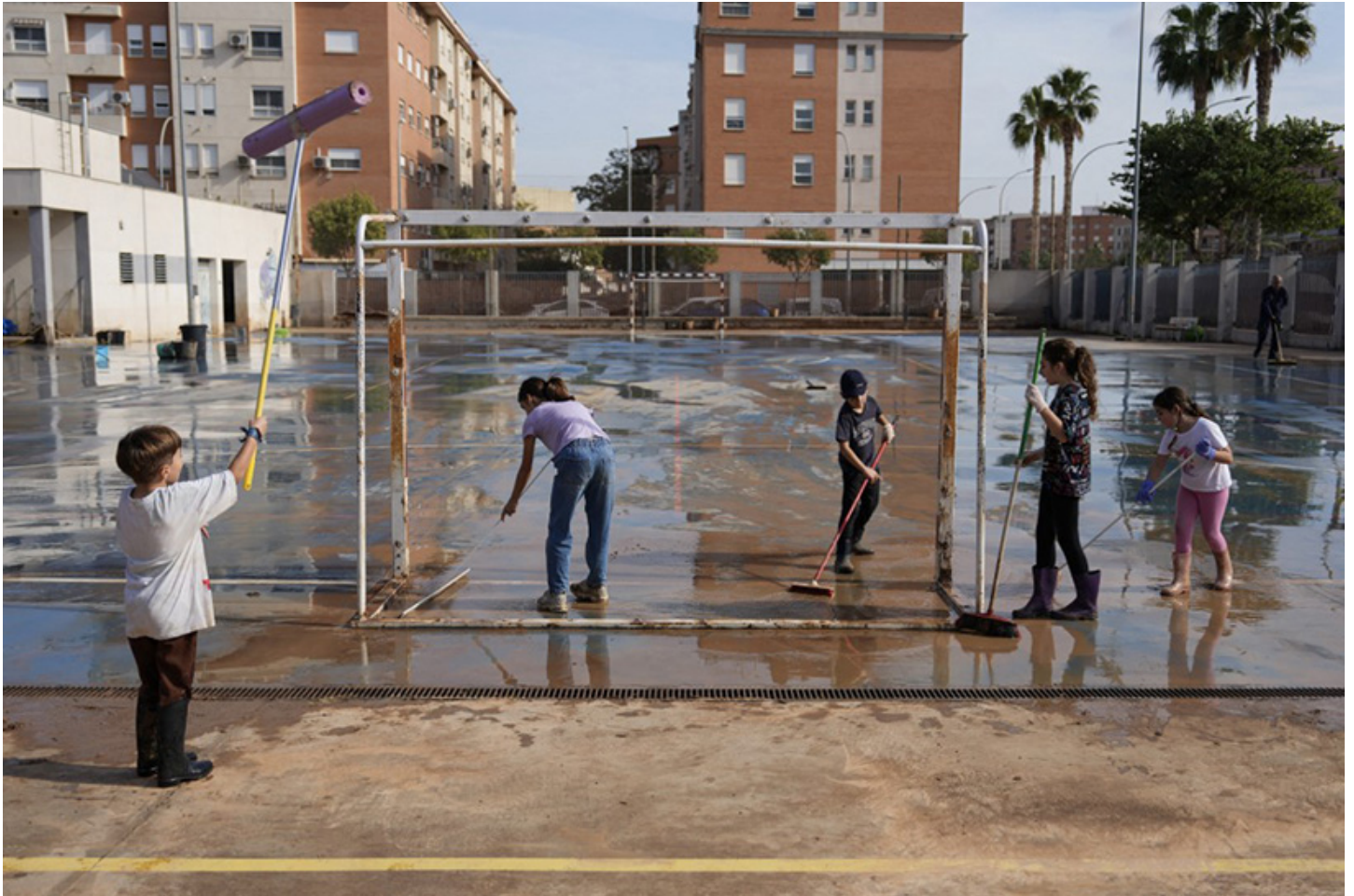
Sur cette photo prise le 5 novembre 2024 dans la ville d'Aldaia, en Espagne, des enfants nettoient la boue et l'eau qui ont inondé leur cour de récré.