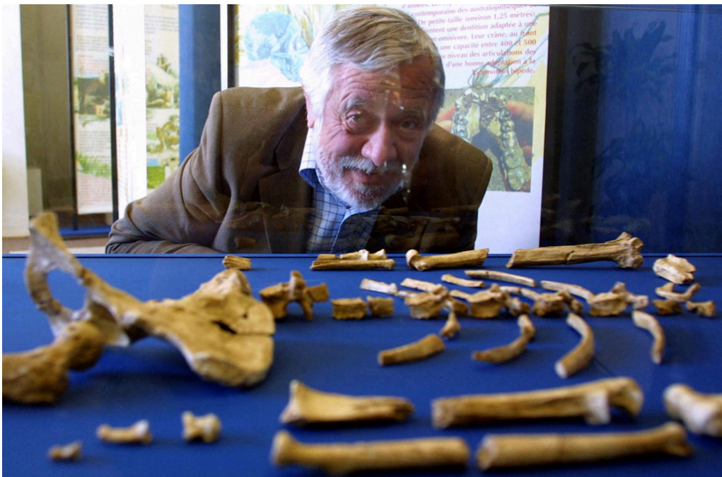
Voici Yves Coppens en 2004,