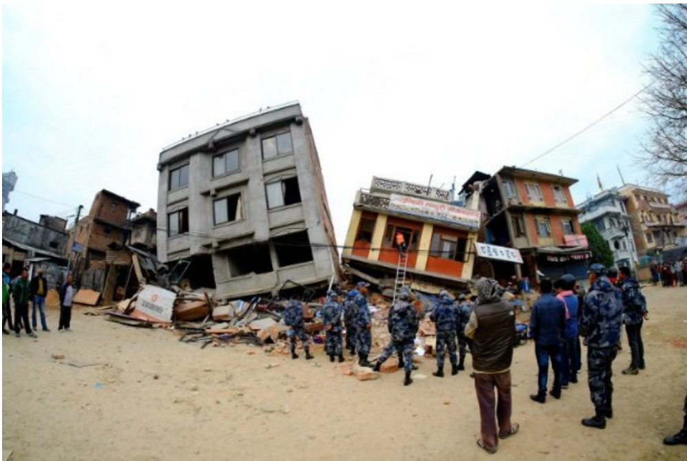
Des habitants de Katmandou et des soldats, le lendemain du séisme. Dimanche 26 avril 2015, à Katmandou.

Le samedi 25 avril, un très violent tremblement de terre a eu lieu au Népal, un pays situé au cœur de l'Himalaya. Sa capitale, Katmandou, a été fortement touchée. Sur le mont Everest, le séisme a déclenché de grandes avalanches. C'est une catastrophe très grave pour ce pays.