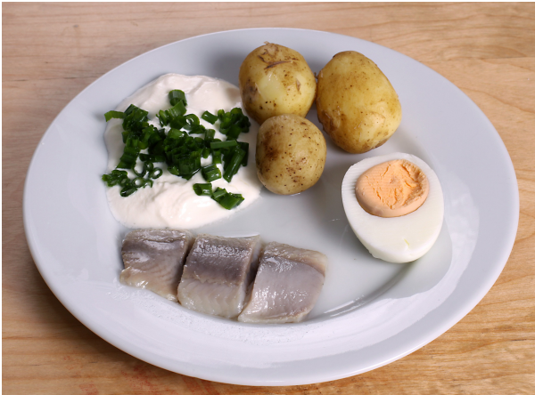
Un plat suédois pour l'été :

Le temps bouge beaucoup, mais il fait parfois chaud, et la température du lac près de ma maison peut atteindre 20 °C.