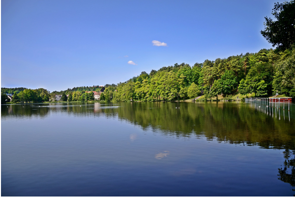
Le paysage du lac

Ramnasjön près de Borås (Amjad Sheikh CC-3.0)