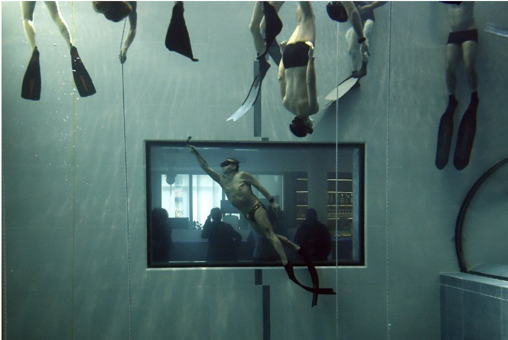
Des plongeurs en apnée pendant un cours du grand apnéiste italien Umberto Pelizzari.

Inaugurée en juin dernier, une piscine italienne de 42 mètres de profondeur connaît un immense succès. Elle a été construite avant tout pour l'entraînement des plongeurs.