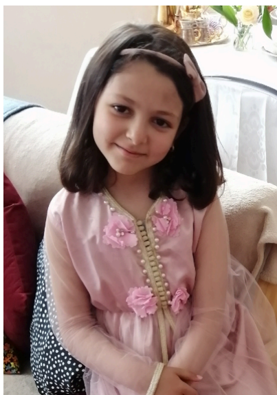
(© D. R.)