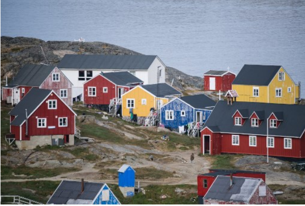
Une vue de Kulusuk, un village groenlandais, au sud-est de l'île.