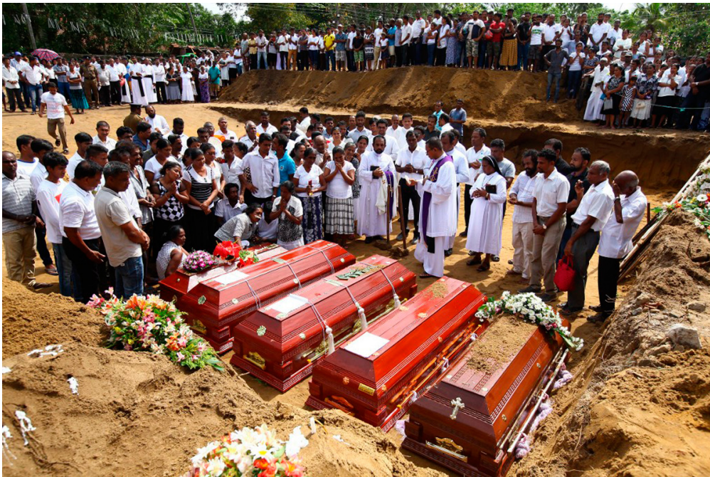
Les habitants du Sri Lanka enterrent leurs morts, deux jours après les attaques terroristes qui ont frappé le pays.

Mise à jour du 26 avril 2019 : quatre jours après ces attentats, le gouvernement du Sri Lanka a revu à la baisse le nombre de victimes. Il y aurait finalement 253 morts.