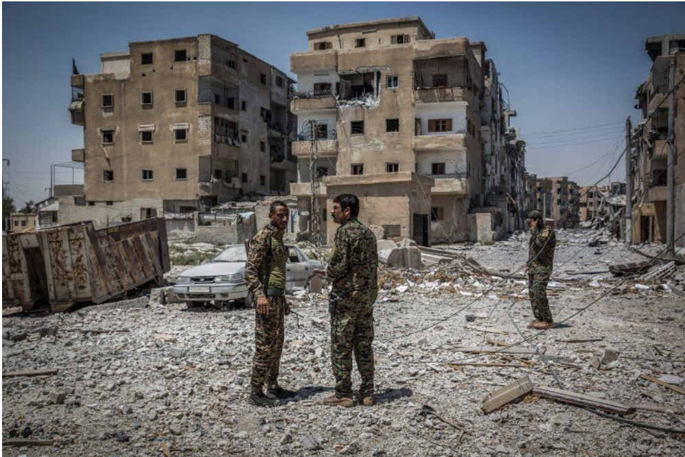
La majorité de la ville de Raqqa, en Syrie, a été détruite pendant la bataille contre les djihadistes de Daesh.

Cette semaine, après 5 mois de combats, l'organisation terroriste Daesh a perdu le contrôle de Raqqa. Elle occupait cette ville de Syrie depuis 2014 et y avait installé son gouvernement. 1jour1actu t'explique en quoi la perte de Raqqa est une véritable défaite pour Daesh.