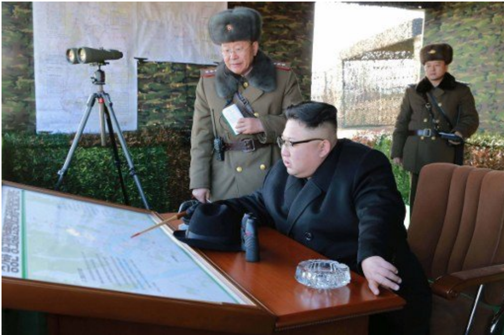
Sur cette photo, tu peux voir le dictateur Kim Jong-un, qui dirige la Corée du Nord, en Asie.

Cette semaine, Kim Jong-un, le dirigeant de la Corée du Nord (en Asie), provoque à nouveau le reste du monde. Il a ordonné des tirs de missiles qui ont atterri dans la mer, près du Japon. Kim Jong-un veut ainsi prouver la force militaire de la Corée. Ces tirs sont pris très au sérieux par l'ONU.