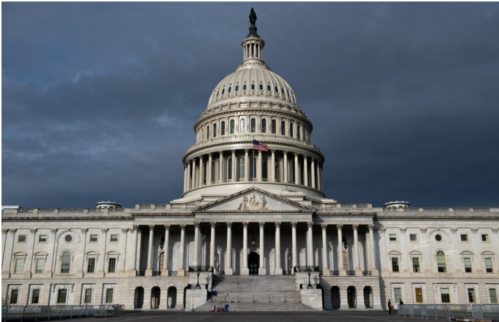
Le Capitole est un bâtiment situé à Washington, aux États-Unis.