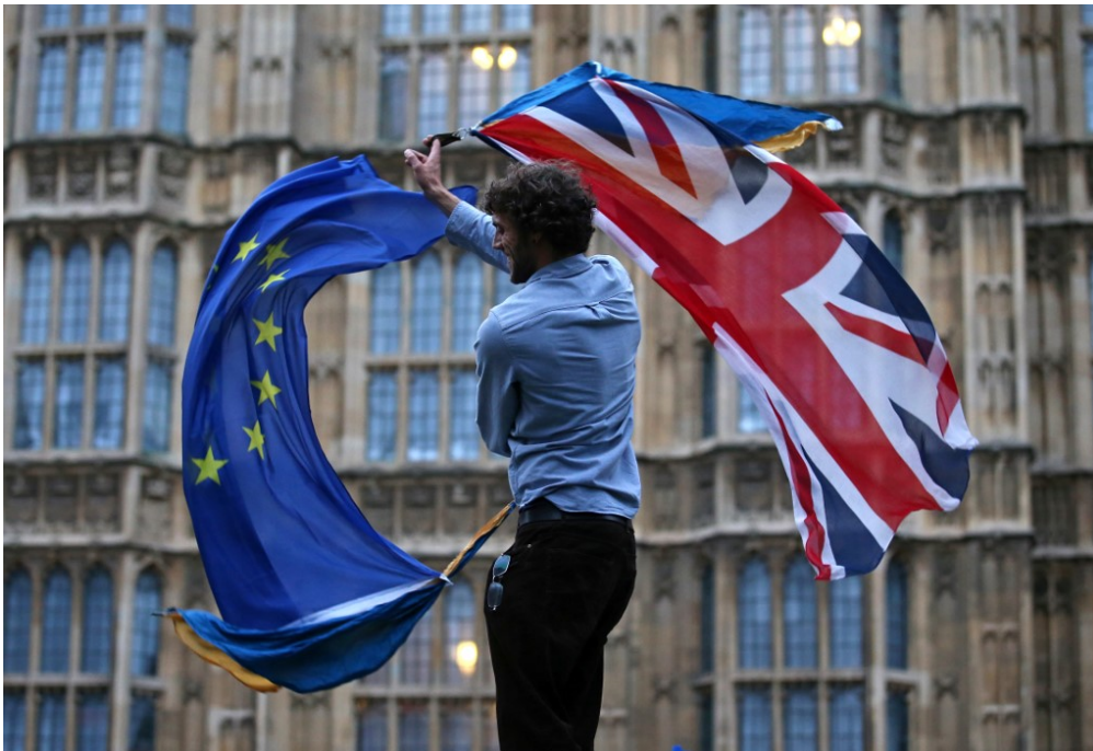
Un homme agite le drapeau de l'Union européenne et celui du Royaume-Uni.

La Grande-Bretagne et l'Union européenne ont signé un accord qui définit leur nouvelle relation après le Brexit. Les changements sont nombreux. Et ils s'appliquent dès demain, 1 er janvier 2021.