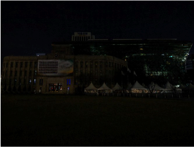
En Corée du Sud, le bâtiment de la mairie a été plongé dans le noir.