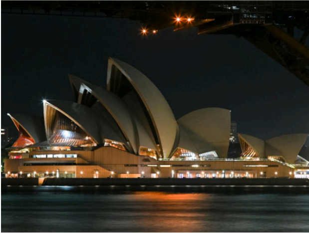
En Australie, voici le célèbre opéra de la ville de Sidney allumé, puis éteint.