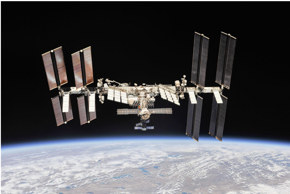
La Station spatiale internationale, vue depuis l'espace.

Cet automne, il va se passer plein de choses dans l'ISS. L'équipage de la Station spatiale va changer, de nouvelles toilettes hypersophistiquées vont être testées... et des Américains vont même voter depuis l'espace?!