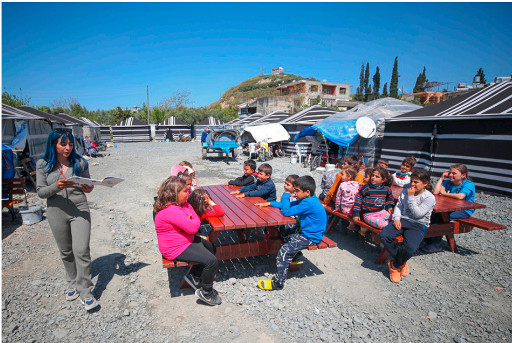
Cette femme propose des activités éducatives aux enfants de la ville d'Hatay. Elle les aide à oublier le drame du tremblement de terre.

En février, de terribles tremblements de terre ont causé plus de 50?000 morts en Turquie et en Syrie, deux pays de l'ouest de l'Asie. Deux mois plus tard, comment vivent les rescapés?? 1jour1actu a posé la question à un expert.