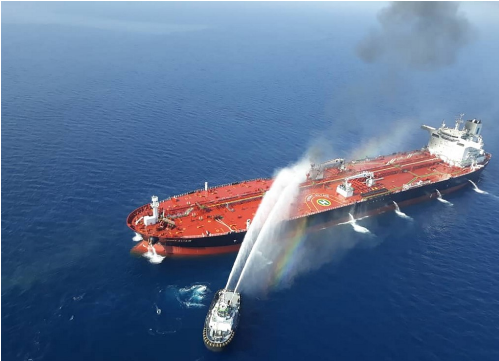
L'un des deux pétroliers attaqués dans le détroit d'Ormuz. Sur la photo, on voit un plus petit bateau tenter d'éteindre le feu.

Le détroit d'Ormuz, situé au Moyen-Orient, est au cœur d'un bras de fer entre les États-Unis et l'Iran. 1jour1actu t'aide à comprendre ce qui se joue de grave dans cette partie du monde.