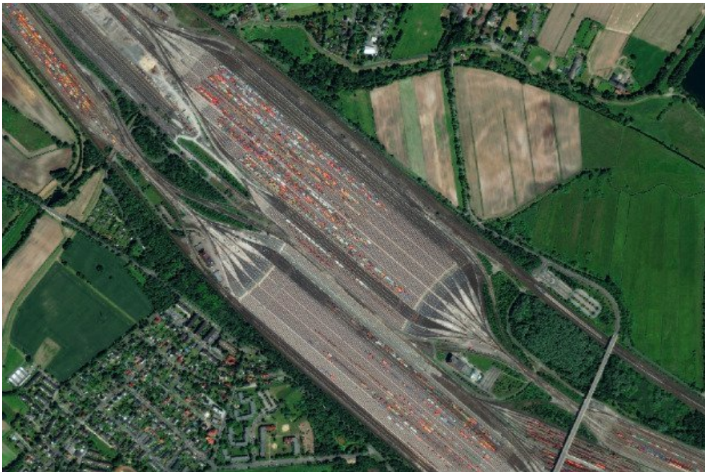
La gare de triage de Maschen en Allemagne

Quelle forme étonnante ! De longues lignes grises et de petits traits de couleur au milieu d'un paysage vert de champs et de forêts. Est-ce que tu devines ce que montre cette image satellite ?