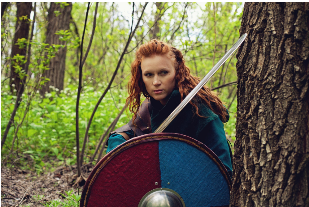
Cette photo est une reconstitution : cette femme est déguisée en chef de guerre viking.