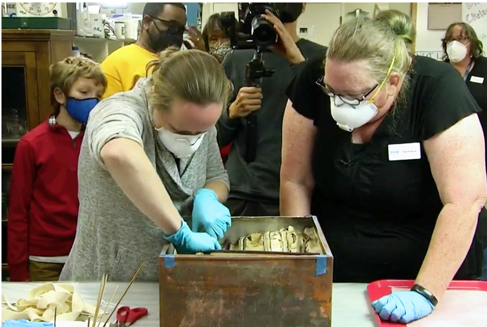
Devant les caméras, la capsule temporelle est ouverte et son contenu dévoilé en direct.

L'histoire qu'1jour1actu te raconte aujourd'hui commence en 1887, il y a plus de cent trente ans. Et pourtant, elle fait l'actu de ce début d'année 2022. Une boîte en métal et son contenu datant du XIXe (19e) siècle viennent d'être retrouvés dans le socle d'une statue aux États-Unis. Il s'agit d'une capsule temporelle.