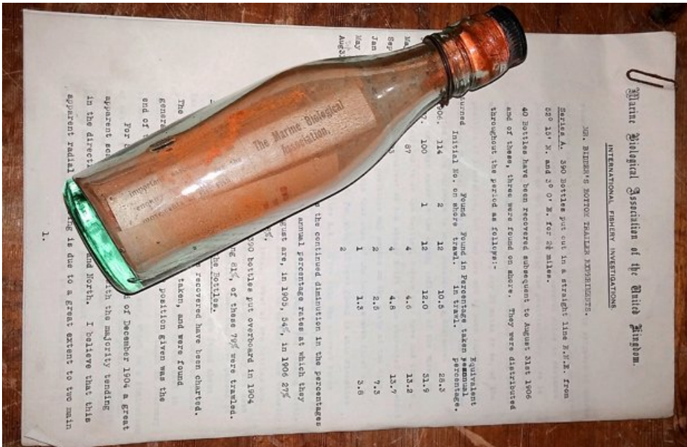
Entre 1906 et 1908, un scientifique anglais a jeté 1020 bouteilles à la mer pour étudier les courants marins. En voici l'une d'elles.