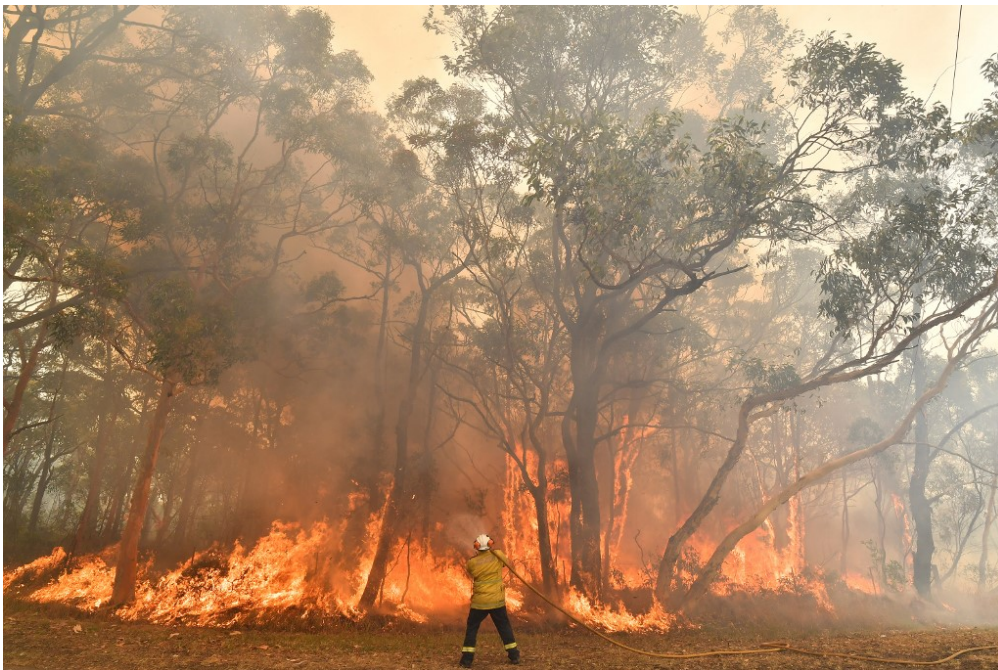
Ce pompier tente de combattre les flammes, à environ 100 km de Sydney.

L'Australie subit depuis trois ans une forte sécheresse, qui déclenche souvent des feux de forêt. Mais, depuis trois mois, attisés par les vents et la chaleur, ces incendies sont devenus gigantesques. Ils touchent surtout le sud-est du pays, là où se concentrent de grandes villes comme Canberra, la capitale, et Sydney, la plus peuplée.