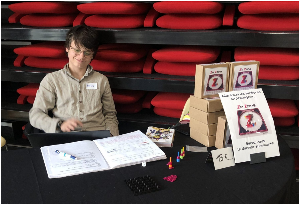
Elfin présente son jeu, Ze zone, dans un festival.

Elfin est un ado créatif, bricoleur et fan de jeux. Avec ses parents, il va souvent dans des festivals de jeux de société . Cela lui a donné des idées pour en créer un lui-même. 1jour1actu l'a interviewé.