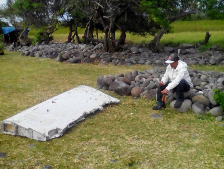
Le morceau d'avion, retrouvé le 29 juillet ? la Réunion.