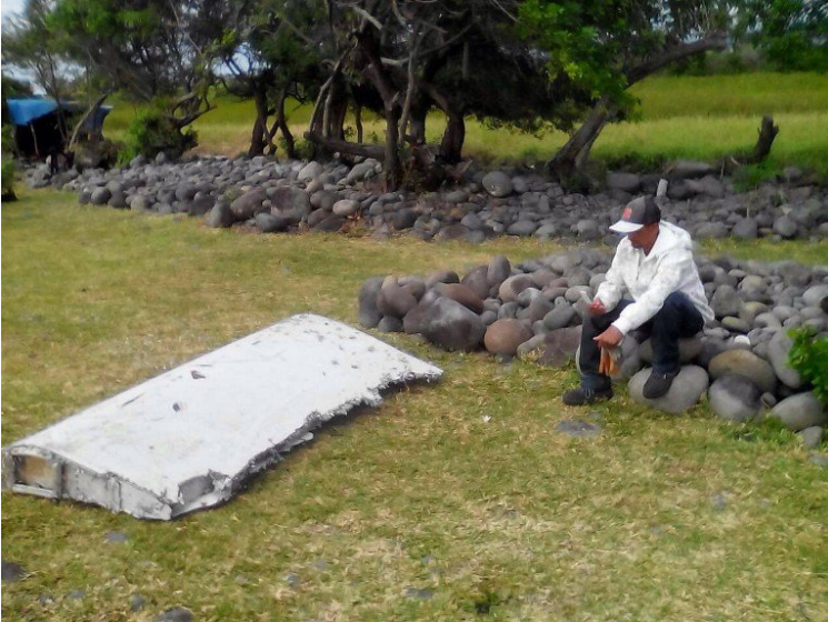
Le morceau d'avion, retrouvé le 29 juillet à la Réunion.

Dans le Nord-Ouest de la Chine, deux énormes explosions se sont produites dans un entrepôt, au cœur d'une zone industrielle, dans la nuit du 12 août. 114 personnes au moins sont mortes, 700 autres sont blessées et des dizaines sont portées disparues. Les habitants s'inquiètent car une substance très toxique , du cyanure de sodium, s'est propagée dans l'atmosphère au moment de l'explosion.– Malaysia Airlines :