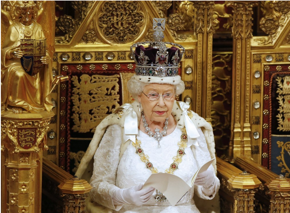
La reine Elizabeth II, sur son trône, en 2016.

Cette semaine, pour préparer ton hebdo, l'équipe d'1jour1actu a enquêté sur Elizabeth II, la reine du Royaume-Uni. Voici les 3 infos qui nous ont le plus surpris.