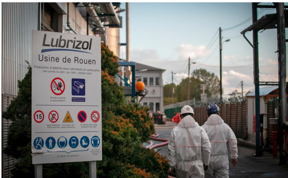
Les p'tits journalistes de la semaine

La semaine dernière, l'usine Lubrizol de Rouen a été en partie détruite par un incendie. Les habitants de la région ont peur d'avoir respiré de l'air pollué. Que s'est-il passé exactement ? Ont-ils raison de s'inquiéter ? Pour en savoir plus, les p'tits journalistes de franceinfo junior, l'émission partenaire d'1jour1actu, ont interrogé une spécialiste.