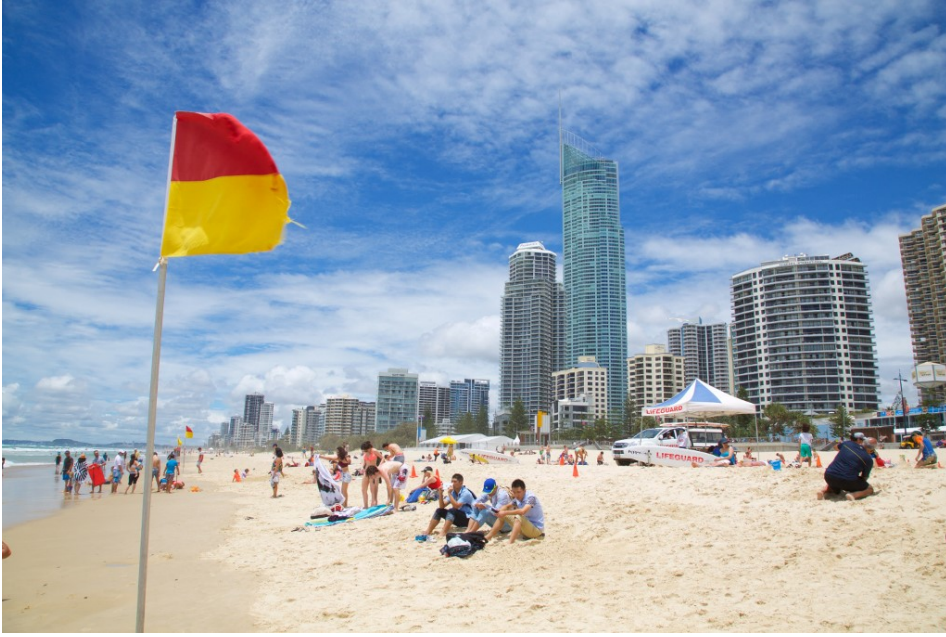
Le même drapeau de lieu de baignade surveillée à Surfers Paradise, en Australie.