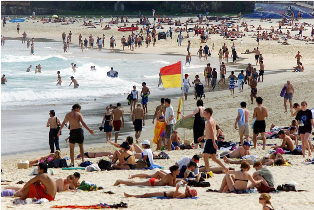
Désormais, les drapeaux sont identiques dans le monde. Celui-ci a été photographié à Bondi Beach, à Sydney, en Australie.

1jour1actu t'explique pourquoi et comment ces drapeaux ont été modifiés.