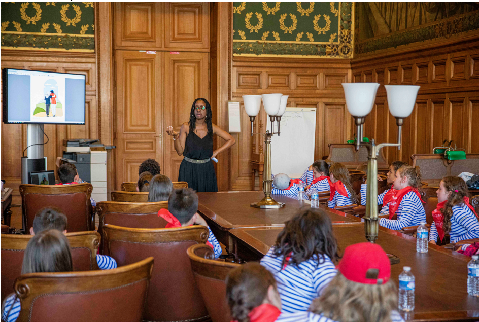
KAM a proposé un débat sur des dessins de symbole de la paix.

Après ces ateliers, les classes ont présenté leur travail aux autres classes et aux invités présents. 5 minutes montre en main, comme des professionnels !