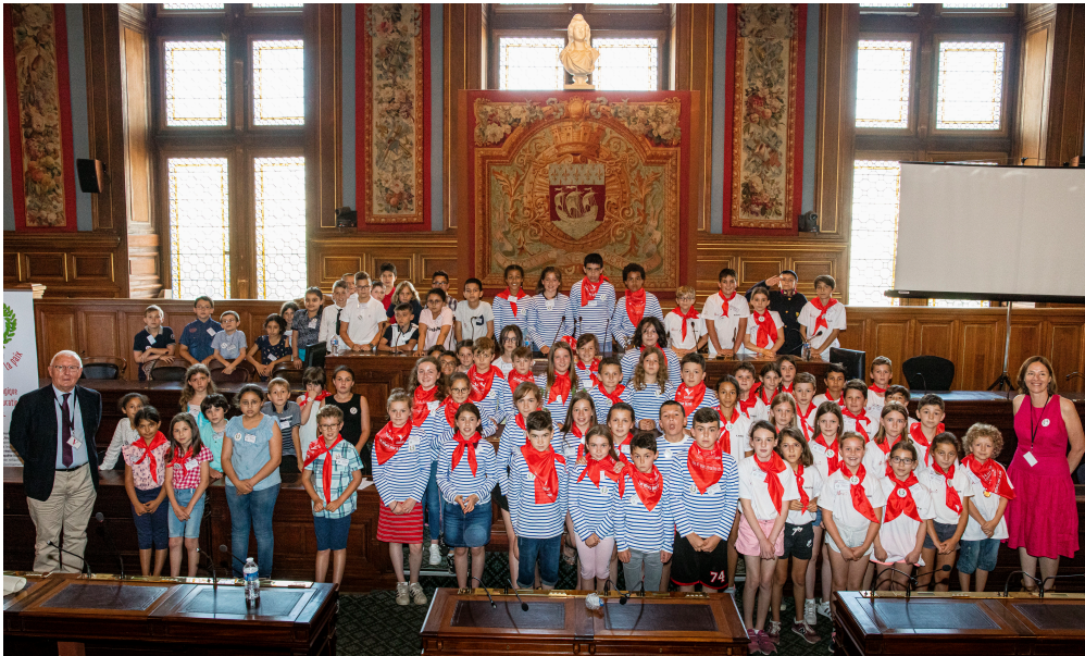
Les 3 classes lauréates du concours « Les enfants pour la paix ».

Les trois classes lauréates du concours « Les enfants pour la paix » ont gagné un voyage à Paris pour recevoir leur prix ce 28 juin. Le rendez-vous était fixé cent ans, jour pour jour, après la signature du traité de Versailles, qui mit fin à la Première Guerre mondiale.