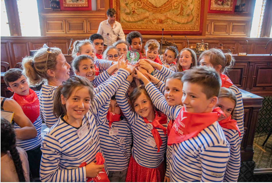
La classe de l'école Julie Daubié de Saint-Ségal reçoit son trophée.