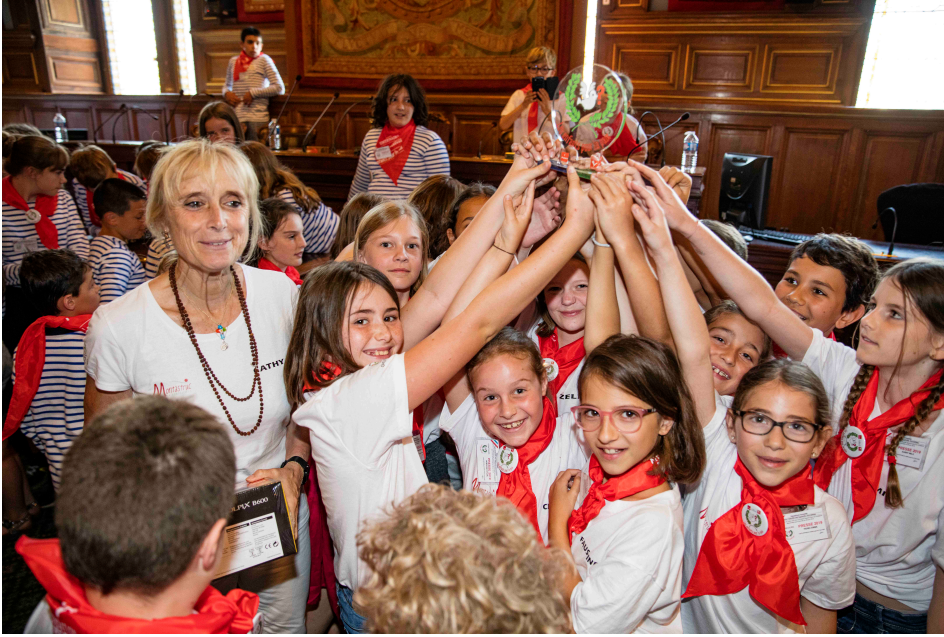
La classe de l'école Vinsonneau à Montastruc-la-conseillère brandit son trophée.