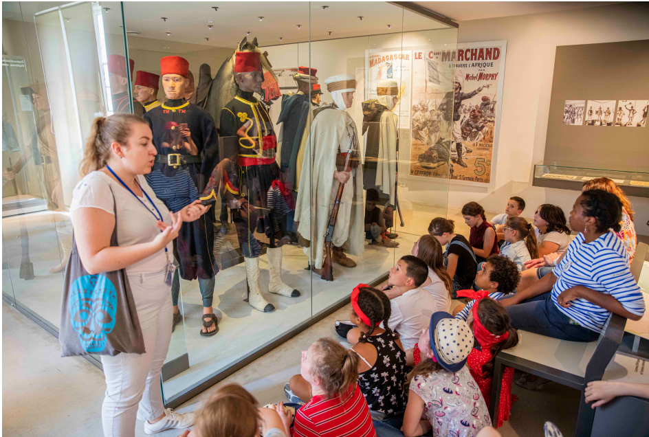
La visite guidée aux Invalides.

Rappel : Les classes sont lauréates du concours « Les enfants pour la paix », lancé en septembre 2018 par Milan presse, la Mission du centenaire de la Première Guerre mondiale et la Fondation Varenne. Plus de 600 classes de CM2 issues de 25 académies avaient participé ? ce concours.