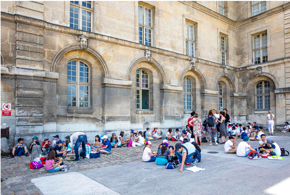
Un grand pique-nique à l'ombre de l'Hôtel des Invalides.

Direction deux bus pour un trajet climatisé dans Paris. La température extérieure frôlait 32 °C. Pour beaucoup d'enfants, c'était la première fois qu'ils venaient à Paris. Donc impossible de ne pas apercevoir la tour Eiffel et les Champs-Élysées ! Les trois classes se sont retrouvées à l'Hôtel des Invalides, pour un grand pique-nique à l'ombre et une visite guidée rapide des lieux. Après cette riche journée, les classes ont repris le chemin du retour.