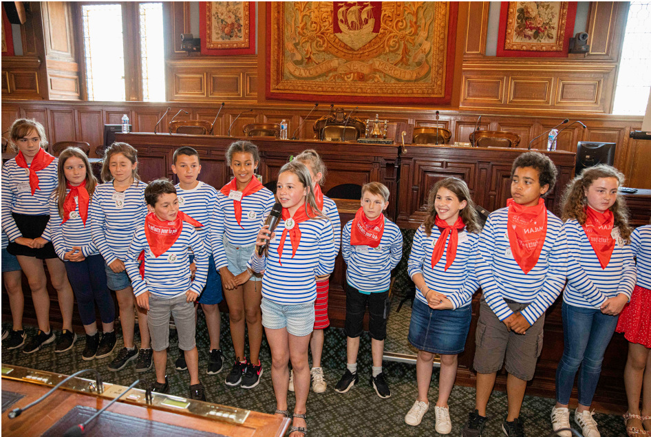
Clin d'œil à leur région d'origine, les Bretons avaient revêtu une marinière pour l'occasion.

Moment de forte émotion ! Les enfants ont reçu leur trophée, un appareil photo et des petits cadeaux, et se sont prêtés aux flashes des photographes.