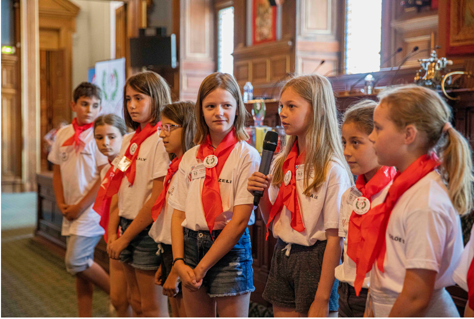
Les élèves de la classe de Montastruc-la-Conseillère portaient des T-shirts avec, au dos, le symbole de la paix qui leur a permis de gagner.