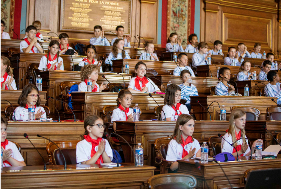
Les enfants siègent dans l'hémicycle du Conseil de Paris.

Les élèves et leurs accompagnateurs se sont réunis à l'hôtel de ville de Paris, dans l'hémicycle du Conseil de Paris , pour la cérémonie de remise des prix. Après les discours d'accueil et de félicitations pour la qualité de son travail, chaque classe a participé à un atelier animé par un dessinateur de presse.