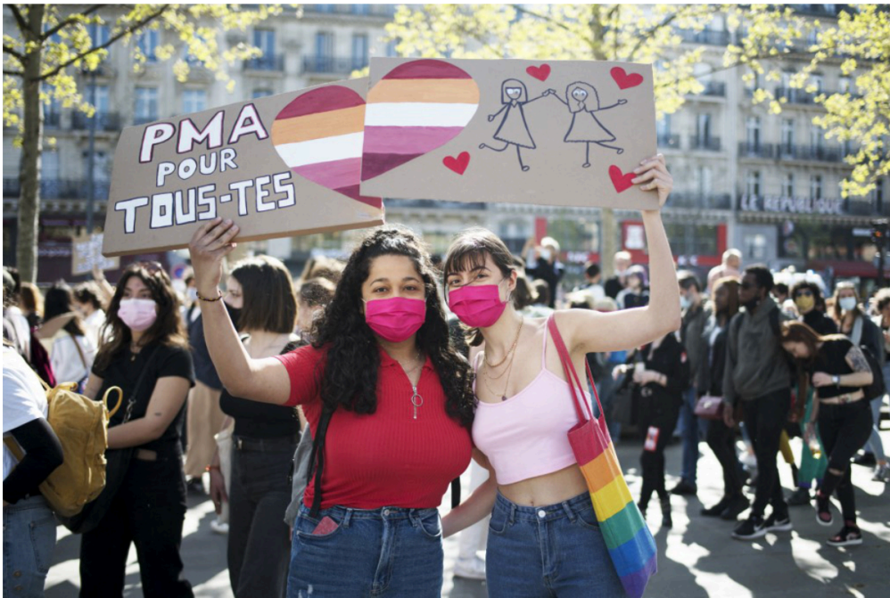
Quelques jours avant le vote, beaucoup de personnes, dans plusieurs villes de France, ont manifesté pour que la loi sur la PMA soit adoptée.

Après des années de débats, la loi autorisant la PMA a été acceptée en France. Toutes les femmes, qu'elles soient en couple avec un homme, une autre femme, ou qu'elles soient célibataires, peuvent désormais avoir un enfant grâce à des techniques médicales. 1jour1actu te parlait déjà de la PMA dans son numéro 247, daté du 11 octobre 2019.