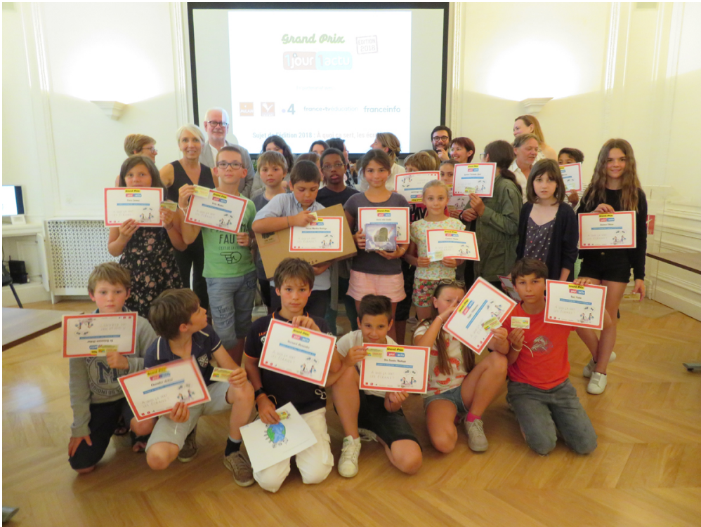
La classe des CM2 de l'école Notre-Dame-de-Piétat, de Condom, réunie pour la remise du Trophée du Grand Prix 1jour1actu 2018