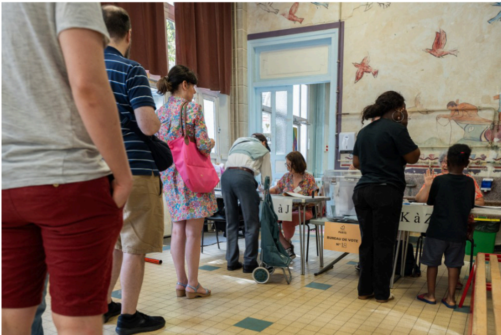
Un grand nombre de Français se sont déplacés pour voter au premier tour des élections législatives, comme dans ce bureau de vote, à Paris.

Le dimanche 30 juin, beaucoup de Français, de 18 ans et plus, sont allés voter au 1er tour des élections législatives. Ces élections ont été décidées par le président de la République, et elles pourraient changer la manière dont la France va être gouvernée.